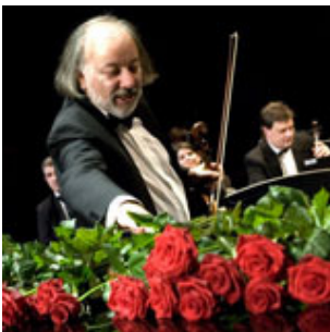
Reportage événementiel pour Maison de la France :