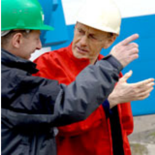
Reportage industriel pour Gaz de France :