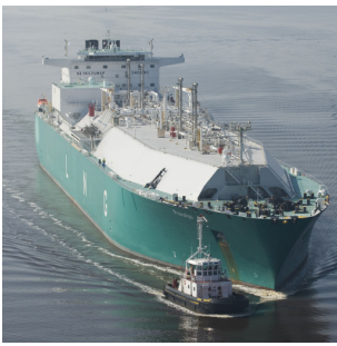
Reportage industriel pour Cofathec :